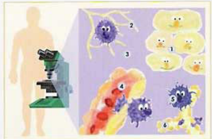
Schematische Darstellung des Gewebenaufbaus bei einem gesunden Menschen.

Bei ausgeglichenem Säure-Basen-Haushalt sind Speichel, Blutserum, Hirnwasser und Urin exakt auf pH 7,4 reguliert. Dies trifft auch auf die meisten Gewebe zu. Ist dieses Zellumgebungsmilieu gewährleistet, so laufen die Stoffwechselreaktionen im Körper (wie z.B. Enzym- und Abwehraktivität) optimal ab.